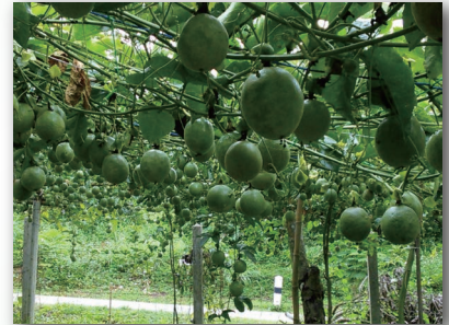
有用酵素を産生するパッションフルーツ