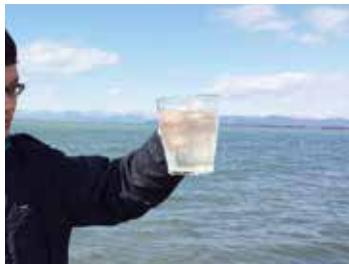
琵琶湖岸における環境DNA(魚類相)調査のための採水