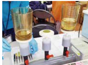
採水サンプルから環境DNAを取り出すための前処理

日 時: 平成30年3月26日(月) 15:30~17:10(交流会17:15~18:30)